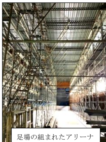
足場の組まれたアリーナ

入学式と始業式が終わるとすぐに工事が始まり、完成は来年の1月末の予定です。今まではアリーナを使っていた体育の授業や朝礼も、地下の小体育館を使って行うことになりました。また、中学生にとって大きなウエイトを占める部活動も、近隣の中野本郷小学校の体育館を使わせていただくことで乗り切るようになりました。