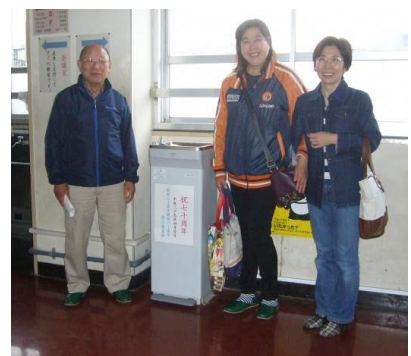
4月26日開校70周年祝う会委員会後

皆さんの活躍を期待して、開校70周年記念として冷水器が寄贈され3階に設置しました。感謝して、大切にしてください。